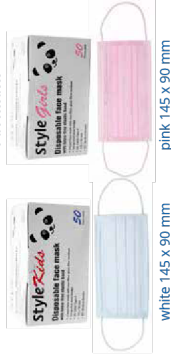
02400-KIDS/GIRLS style Mundschutz/ Facemask