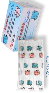
02501 Happy Kids Mundschutz/ Happy Kids facemask