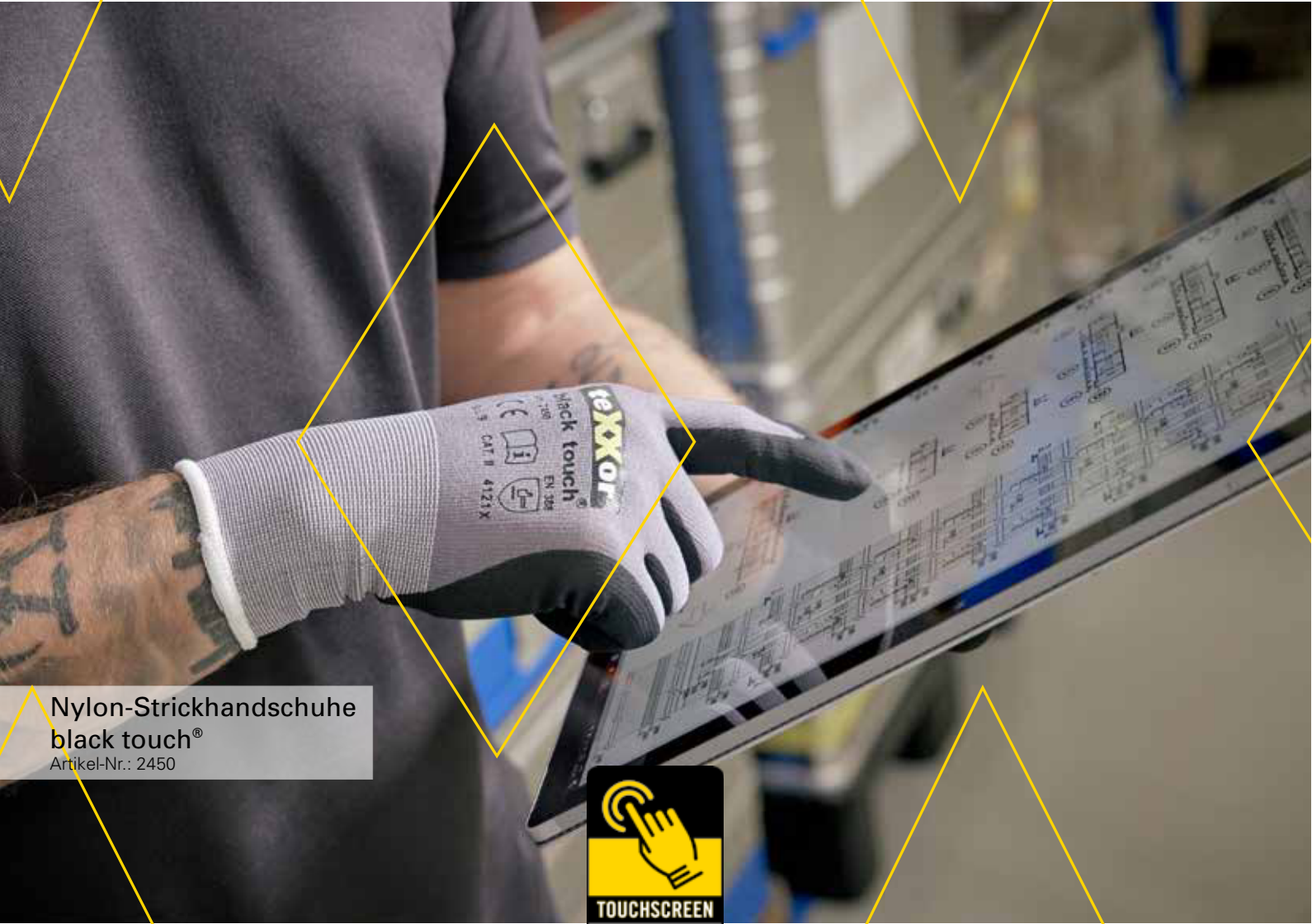
Nylon-Strickhandschuhe black touch® Artikel-Nr.: 2450