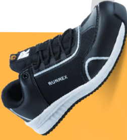
Artikel-Nr.: 5113* schwarz-weiß