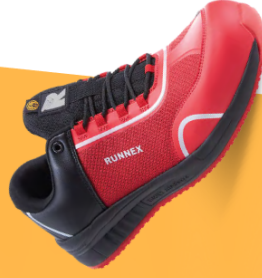
Artikel-Nr.: 5114* rot-schwarz