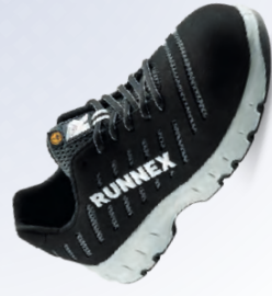
Artikel-Nr.: 5178 schwarz-grau