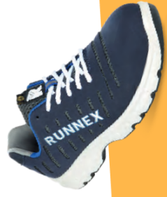
Artikel-Nr.: 5173 blau-weiß