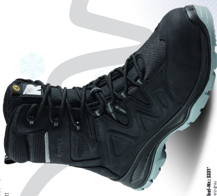
Artikel-Nr.: 5331* schwarz-grau

*zertifiziert nach der neuen Europäischen Norm EN ISO 20345:2022