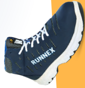
Artikel-Nr.: 5174 blau-weiß