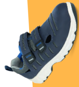
Artikel-Nr.: 5177 blau-weiß