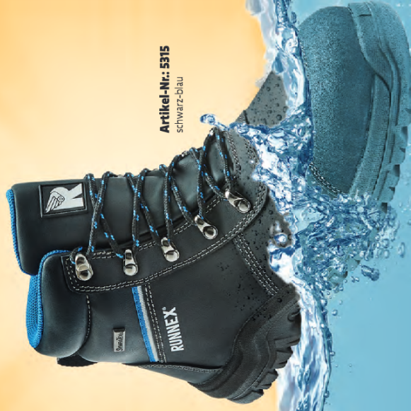
Artikel-Nr.: 5315 schwarz-blau

Die sehr bequemen, atmungsaktiven Sicherheitsschnürstiefel RUNNEX® S3-Sympatex® SpecialStar 5315 definieren ein neues Level. Sie sind mit der komfortablen activeBumper-Dämpfung und einer langlebigen, 100 % wasserdichten Sympatex®-Membran ausgestattet. Für optimales Schuhklima sorgt zudem das AIRSTREAM -Funktionsfutter.