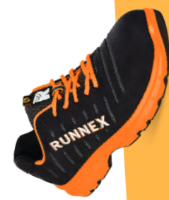
Artikel-Nr.: 5175 schwarz-orange