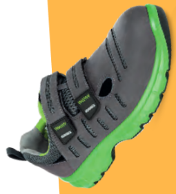
Artikel-Nr.: 5171 grau- grün