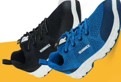
Artikel-Nr.: 5104 blau-weiß