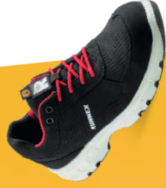
Artikel-Nr.: 5179 schwarz-rot