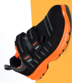
Artikel-Nr.: 5176 schwarz-orange