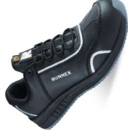
Artikel-Nr.: 5348* schwarz