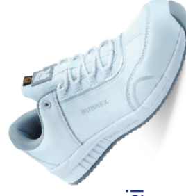
Artikel-Nr.: 5347* weiß