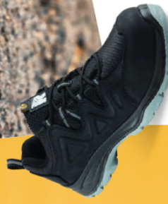
Artikel-Nr.: 5302* schwarz-grau