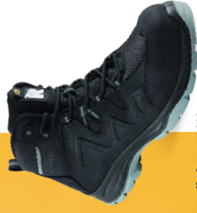
Artikel-Nr.: 5303* schwarz-grau