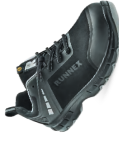
Artikel-Nr.: 5370 schwarz-grau