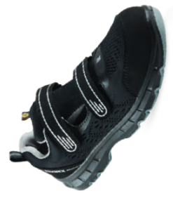
Artikel-Nr.: 5116* schwarz-grau