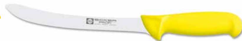
Filiermesser/slicer Cuchillo para filetar