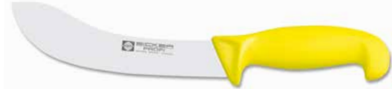
Hautmesser/Skinning Knife Cuchillo Desollador