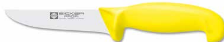
Ausbeinmesser breit/Boning Knife wide Cuchillo para deshuesar ancho