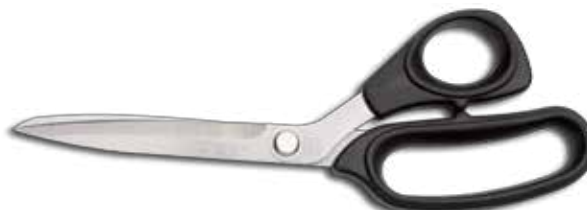
Geflügelschere/Poultry Shears/Tijeras aves de corral