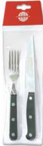
Steakbesteck Steak Knife Set Cubiertos de carne