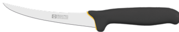
Ausbeinmesser steif Boning Knife stiff Cuchillo para deshuesar duro