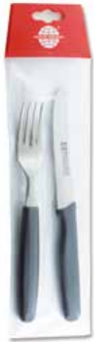
Tischmesser Table Knife Set Cuchillos de mesa