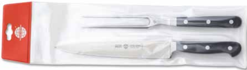
Tranchierbesteck / Carving Set / Talla cubiertos (24.560.21 + 24.390.15)