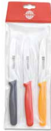
Tischmesser mit Säge Table Knife Set with serration Cubierto de mesa con sierra