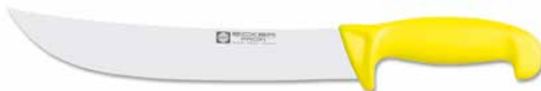
Blockmesser amerikanische Form/Butcher Knife American style Cuchillo de carnicero estilo american