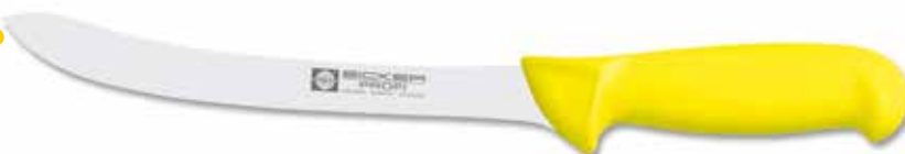
Sortiermesser /Trimming Knife Cuchillo despiece