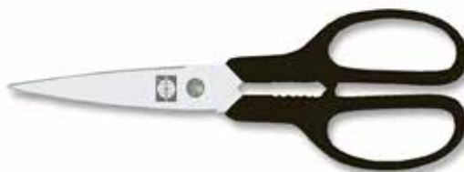
Haushaltsschere rostfrei/Houshold Scissors stainless/Tijera hogar/inoxidable