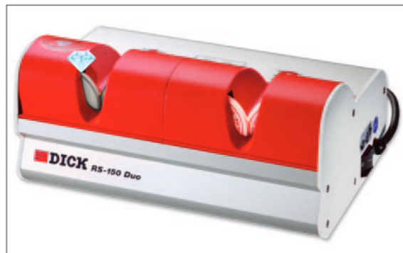
Schleifmaschine mit Abziehvorrüstung für höchste Ansprüche DICK RS-150 DUO

Ausführliche Informationen über unser Sortiment senden wir Ihnen gerne zu.