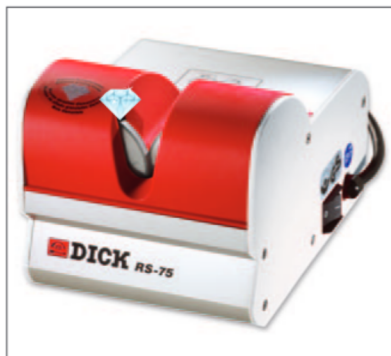
Schleifmaschine DICK RS-75

Als führender Messerhersteller hat Friedr. Dick natürlich auch Kompetenz in Sachen Schärfe für alle Messertypen. Beim Schleifen von Handmessern gibt es die unterschiedlichsten Anforderungen. F. Dick bietet individuelle Lösungen z. B. für den Küchen- und Ladenbereich: