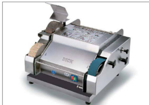
Universalschleifmaschine DICK SM-160 T