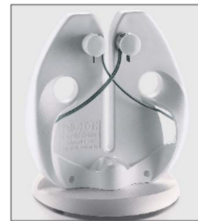
Zubehör: Standplatte Art.-Nr. 9 008106-05