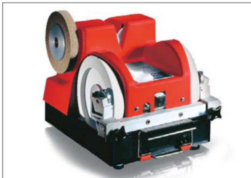
Schleif-, Abzieh- und Poliermaschine DICK SM-111

Als führender Messerhersteller hat DICK natürlich auch Kompetenz in Sachen Schärfe für alle Messertypen. Beim Schleifen von Handmessern gibt es unterschiedlichste Anforderungen. DICK bietet individuelle Lösungen z. B. für Fleischer-Handwerk und Industrie: