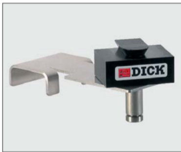
Zubehör: Halter zum Befestigen am Arbeitsplatz Art.-Nr. 9 008102