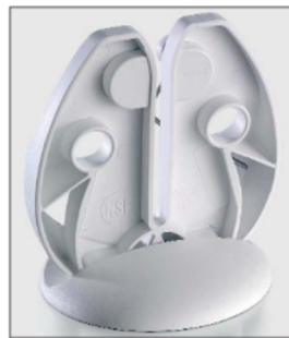
Hygienisches, geschlossenes Federsystem