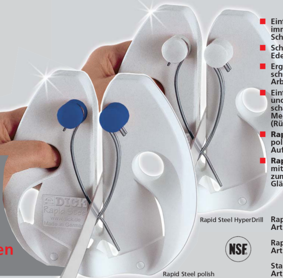
Rapid Steel HyperDrill

Ideal für Fleisch- industrie und Fleischereien